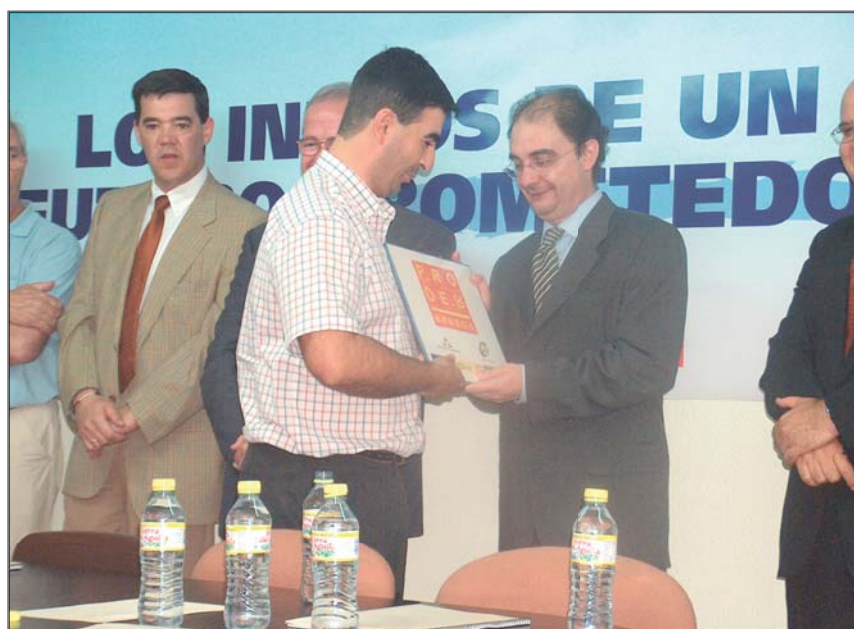
De la Sierra de Algairén a los valles del Jalón y el Huerva

976 81 73 08 de lunes a viernes de 9 a 14 y de 16 a 19